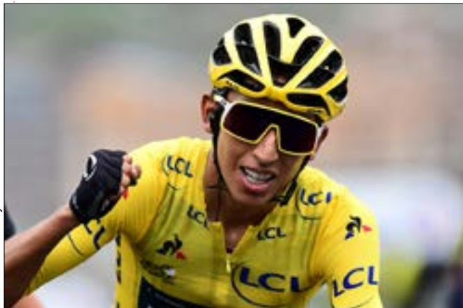
Egan Bernal, Tour de France, 2019.

propre équipe, ce que sa victoire de l'an dernier ne suffit pas à lui garantir. Froome et Thomas ont certes 35 et 34 ans, mais ils ont cinq Tours de France au compteur à eux deux, ce qui ne s'écarte pas d'un revers de la main. Et s'ils ne représentent pas l'avenir, ils peuvent encore prétendre incarner le présent. Mais il ne suffit pas de le dire: il va falloir le prouver. La route décidera.