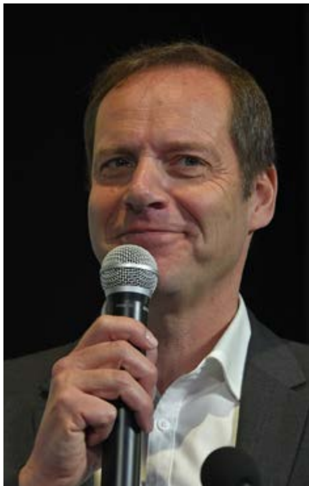
Christian Prudhomme, directeur du Tour de France.

bordures d'Albi, l'an dernier, nous ne l'avions pas prévue! Et aujourd'hui, il y a quelques coureurs très jeunes qui bousculent l'ordre établi, à commencer par Egan Bernal qui gagne le Tour à 22 ans. Peut-être des Mathieu van der Poel ou des Remco Evenepoel rendront bien vite les étapes de plaine plus passionnantes qu'actuellement.