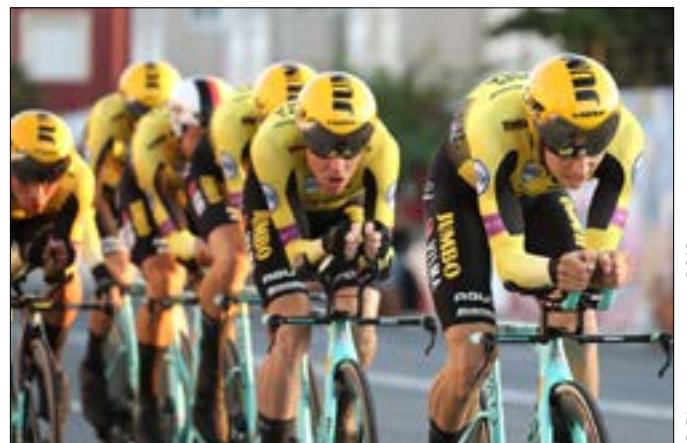
La team Jumbo, Tour d'Espagne, 2019.

Il n'y a pas que chez Ineos que les querelles de leaders risquent de faire des nœuds aux cerveaux des directeurs