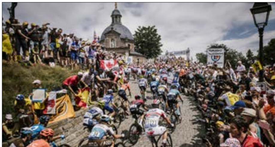
Tour de France 2019, première étape, Bruxelles – Bruxelles, mur de Grammont.