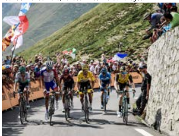
Tour de France 2019, Tarbes – Tourmalet Barèges.