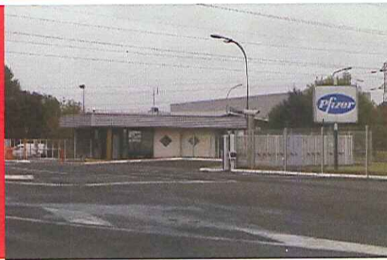
L'entrée de l'usine Pfizer à Amboise.

Pfizer : Les salariés d'Amboise apprennent la vente de leur site lors d'un C.E extraordinaire! Par Michel Eudenbach Délégué syndical F.O Pfizer.