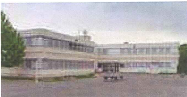
Le collège Paul Valéry AV de Bois Aubry à Tours-Nord