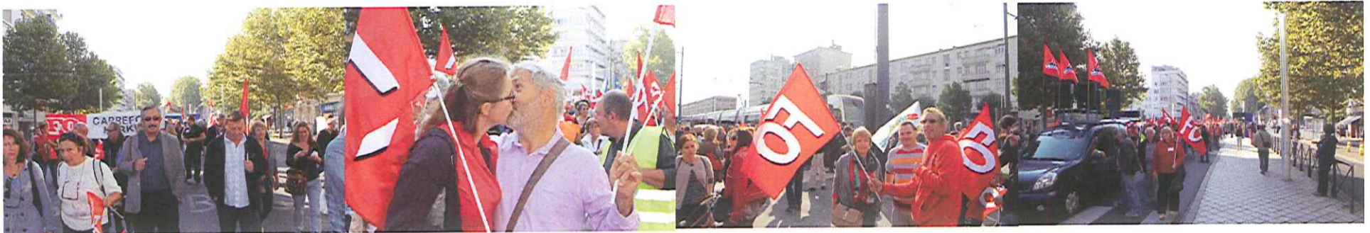
La banderole Carrefour Market Dans le cortège FO de la poésie aussi... Salariés du secteur social privé en force La voiture sono de tête du cortège FO

Des banderoles remarquées: Carrefour Market, unité SGP F.O. Police. Des salariés du privé et du public dans tous les cortèges!