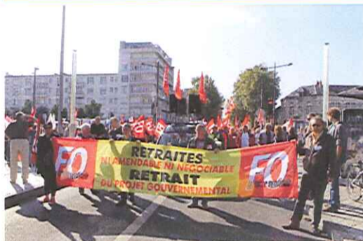
Une revendication qui a le mérite d'être claire!

10 Septembre : Ni amendable! Ni négociable !