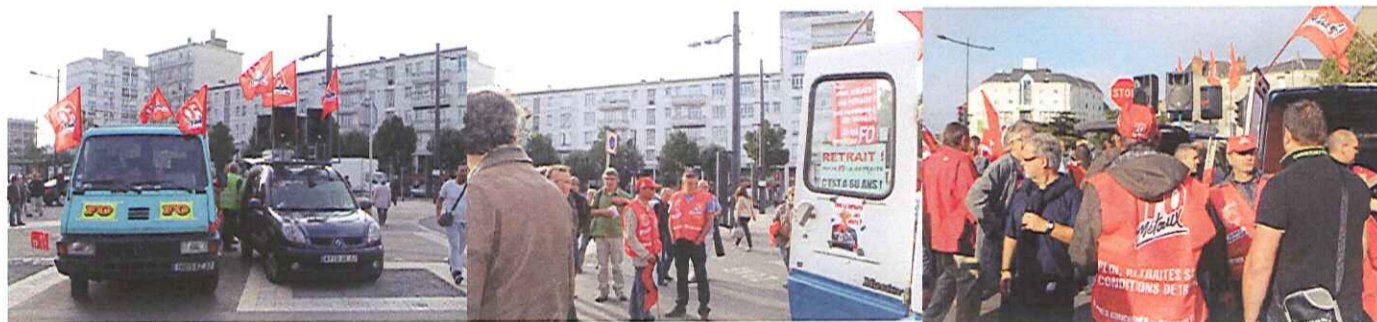
Les militants préparent le cortège. Banderoles, drapeaux, autocollants « retrait » sont distribués au cul du camion.

Retrouvez toutes les infos, déclarations, tracts, appels, lettres de l'U.D F.O. sur son site : http://37.force-ouvriere.org