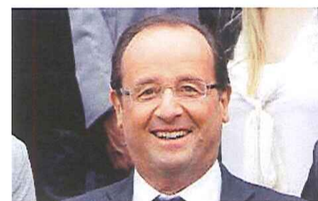
François Hollande. Le président des entreprises

Le scoop de la Gazette: Comme moi, vous avez remarqué que pour les médias une réforme courageuse est une réforme qui consiste à liquider les acquis de la classe ouvrière. Ce que le président Sarkozy a rêvé, le président Hollande l'a fait. Mais, il reste beaucoup d'autres