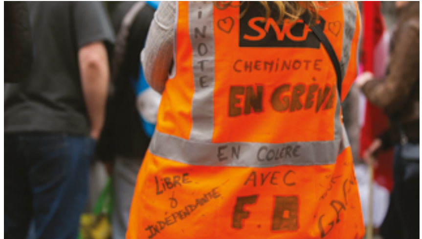
Les cheminots, en grève pendant plus de deux mois avant l'été 2018, ont montré leur détermination à sauvegarder leur statut.

Étant eux-mêmes à la veille d'élections professionnelles à la SNCF, les cheminots FO ont participé nombreux au meeting de Marseille.