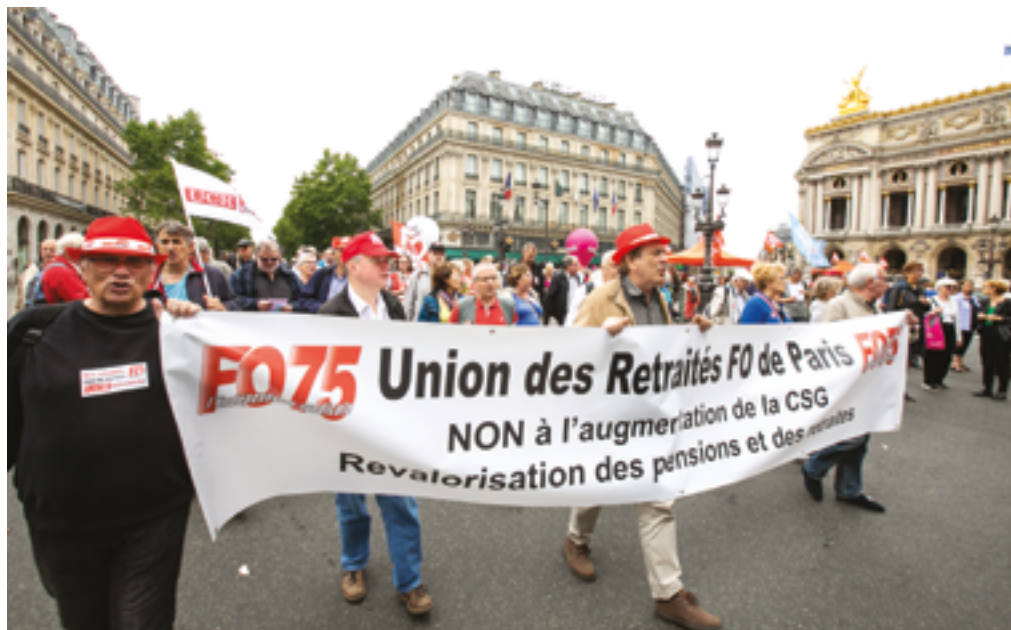
Manifestation des retraités contre l'augmentation de la CSG et pour la revalorisation des pensions et des retraités, le 14 juin 2018, à Paris.

Emmanuel Macron avait annoncé un vote de la réforme « dans le premier semestre » 2019. Mais le calendrier marque le pas. Après la trêve estivale, la concertation ne reprendra que le 10 octobre, par une réunion de l'ensemble des interlocuteurs sociaux. Objectif fixé par le Haut-commissaire à la réforme des retraites : tirer le bilan des six premiers mois de concertation et préciser le cadre des travaux pour les six prochains mois. La concertation pourrait déborder sur l'hiver 2019. Seule certitude sur le fond : le gouvernement annonce « un système universel, dans lequel chaque euro cotisé donne les mêmes droits à tous les Français ». FO demande des éléments concrets sur les effets de la future contre-réforme. Elle a déjà dit son opposition à un régime unique par points, qui signerait une individualisation du système, au détriment des droits et du niveau des pensions des retraités actuels et futurs. FO revendique le maintien du