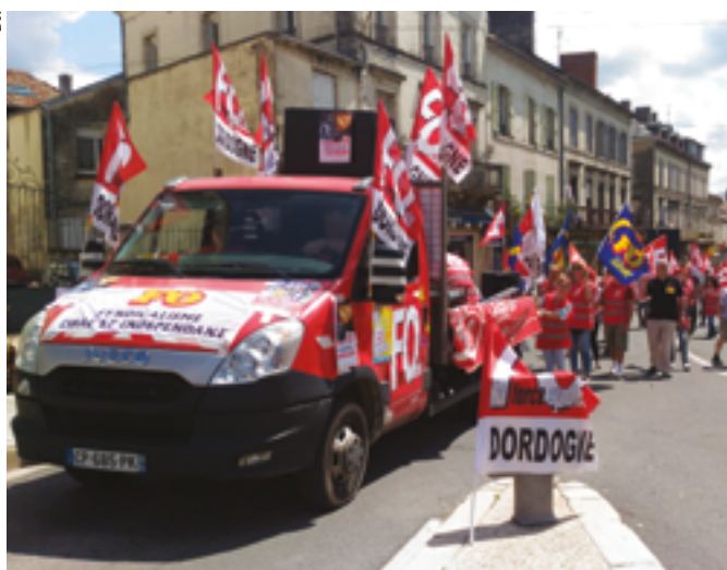
Manifestation de la fonction publique le 22 mai 2018 à Périgueux.

Le chef de l'État était en visite près de Périgueux le 19 juillet. L'union départementale FO a saisi l'occasion.