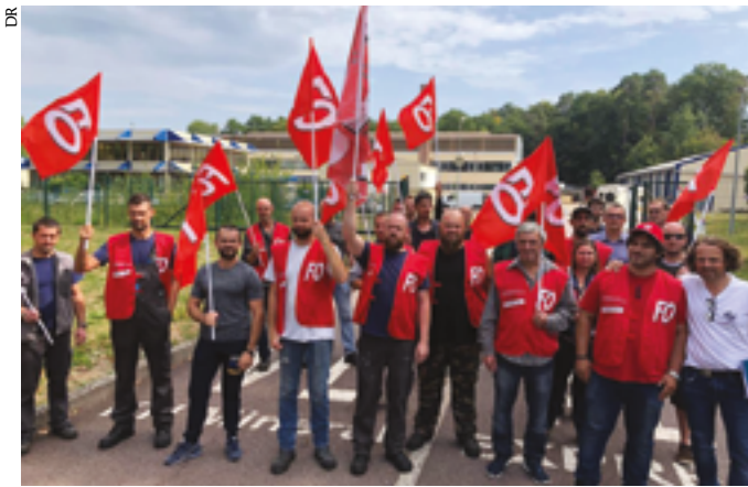
Les militants FO de ThyssenKrupp Industrial Solutions à Sarreguemines.