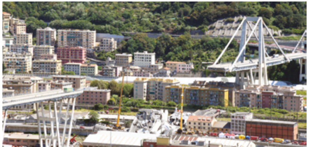
Le pont Morandi à Gênes après son effondrement le 14 août 2018.

« Après Gênes, personne ne peut plus dire "ça n'arrivera pas" », alerte FO. Si les ouvrages du réseau national sont bien surveillés, l'état du patrimoine géré par les petites collectivités locales est plus inquiétant.