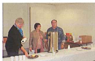
Un café et autres boissons matinales appréciées avec un cake avant de commencer...