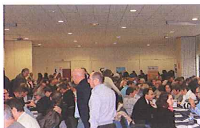
La salle: les militants et militantes s'installent dans le tumulte joyeux des retrouvailles...