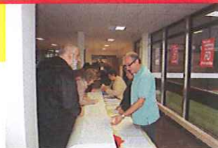
A l'accueil : une équipe bien rodée