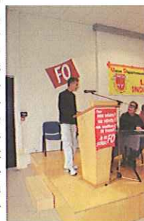
Thierry Duvnjak combatif!