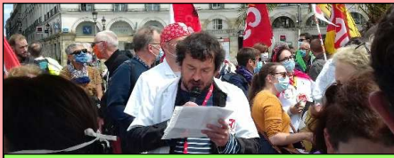
Discours du Secrétaire du Groupe-ment Départemental FO Santé à la

Mes camarades travailleurs de la santé et usagers de la santé,