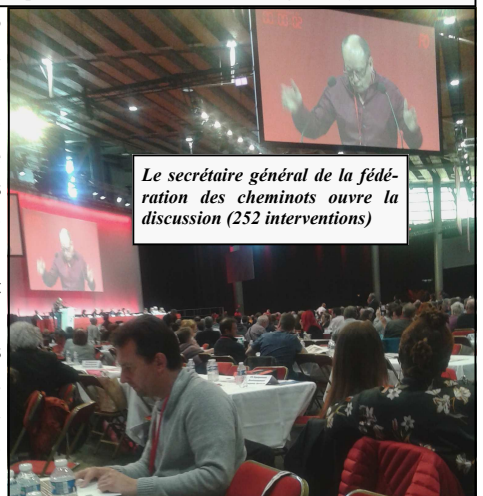
Le secrétaire général de la fédération des cheminots ouvre la discussion (252 interventions)

Entre autres : mandat a été donné au bureau confédéral, de prendre contact avec toutes les autres confédérations afin d'engager des discus-