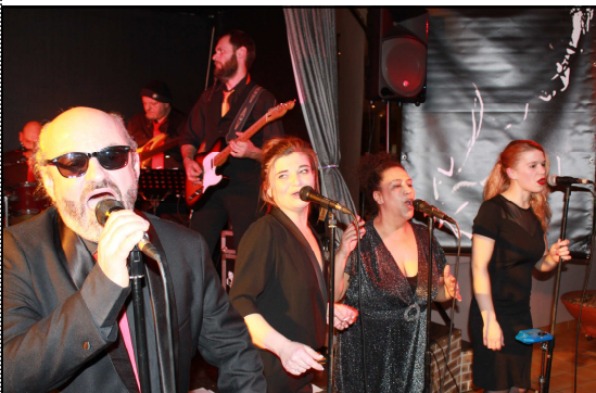
« C'est la lutte finale » façon Blues Brothers !