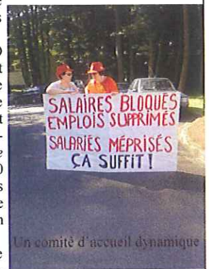
Un comité d'accueil dynamique

*contre tous les avis des instances consultées!