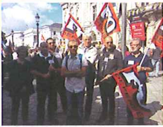
L'équipe militante FO Défense

"Le 13 février 2014, ont eu lieu les élections des comités sociaux du ministère de la Défense. Ce scrutin intermédiaire revêtait un double enjeu, en mesurant l'intérêt des agents pour l'action sociale aux Armées d'une part, et l'audience des syndicats avant les élections professionnelles du 4 décembre dans les trois versants de la fonction publique d'autre part. Avec plus de 32% des voix au niveau national, Force Ouvrière confirme sa première place au ministère, avec un taux de participation supérieur à 62%. Au comité social de Tours, Force Ouvrière Défense Tours remporte 3 des 5 sièges, avec près de 44% des suffrages pour une participation de 67%, loin devant la CFDT (26%) et la CGT (19%). Par rapport au scrutin comparable du CTM 2011, Force Ouvrière progresse de 7 points! Marc Tardy