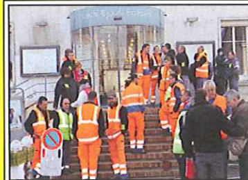
Rassemblement devant la mairie de Montlouis. Du « jamais vu » soulignait la N.R.