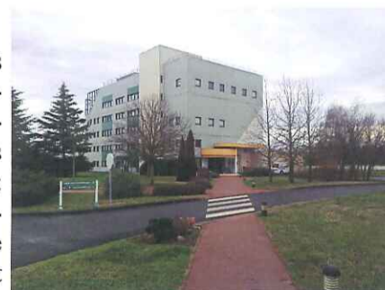
Bâtiments direction PFIZER à Amboise