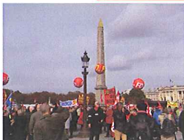
Rassemblement devant l'assemblée nationale le 15 octobre dernier à l'appel de la confédération

Les organisations syndicales patronales, en particulier le M.E.D.E.F., n'ont jamais dissimulé leur dessein : « il faut baisser le coût du travail ». Pour cela, les gouvernements se succèdent et la stratégie ne varie guère : exonérer de cotisations sociales les patrons et rester sourd aux revendications des salariés ! Ce qui fait dire actuellement à Jean-Claude Mailly, secrétaire général de notre Confédération : « quand les patrons pleurent, le gouvernement leur fait passer des mouchoirs ». La traduction de la baisse du coût du travail pour les salariés, c'est le blocage des salaires et la baisse du salaire différé (retraites) mais aussi la fragilisation d'un édifice qui nous est cher : la Sécurité Sociale.