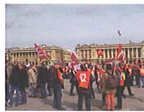
Devant l'assemblée nationale le rassemblement F.O.