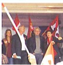
Les secrétaires généraux de deux confédérations pendant que les militants scandent: RETRAIT!