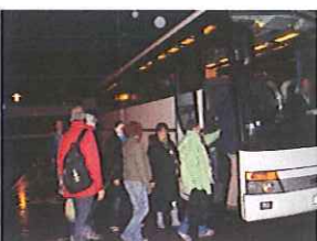
En car « La délégation » de l'UD FO 37!

Le 15 octobre 2013, à Tours les militants de la délégation FO se prépare à monter en car à Paris! la Confédération Force Ouvrière, appelle ses militants à se masser (le jour du vote de la contre réforme par les députés) devant l'assemblée nationale. La CGT nous y rejoint puis SUD solidaires et la FSU. !