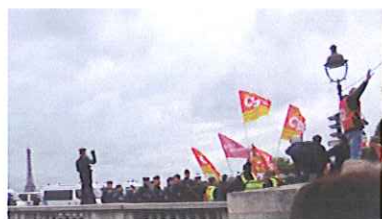
En cortège les militants de la CGT rejoignent le rassemblement à l'initiative de F.O.