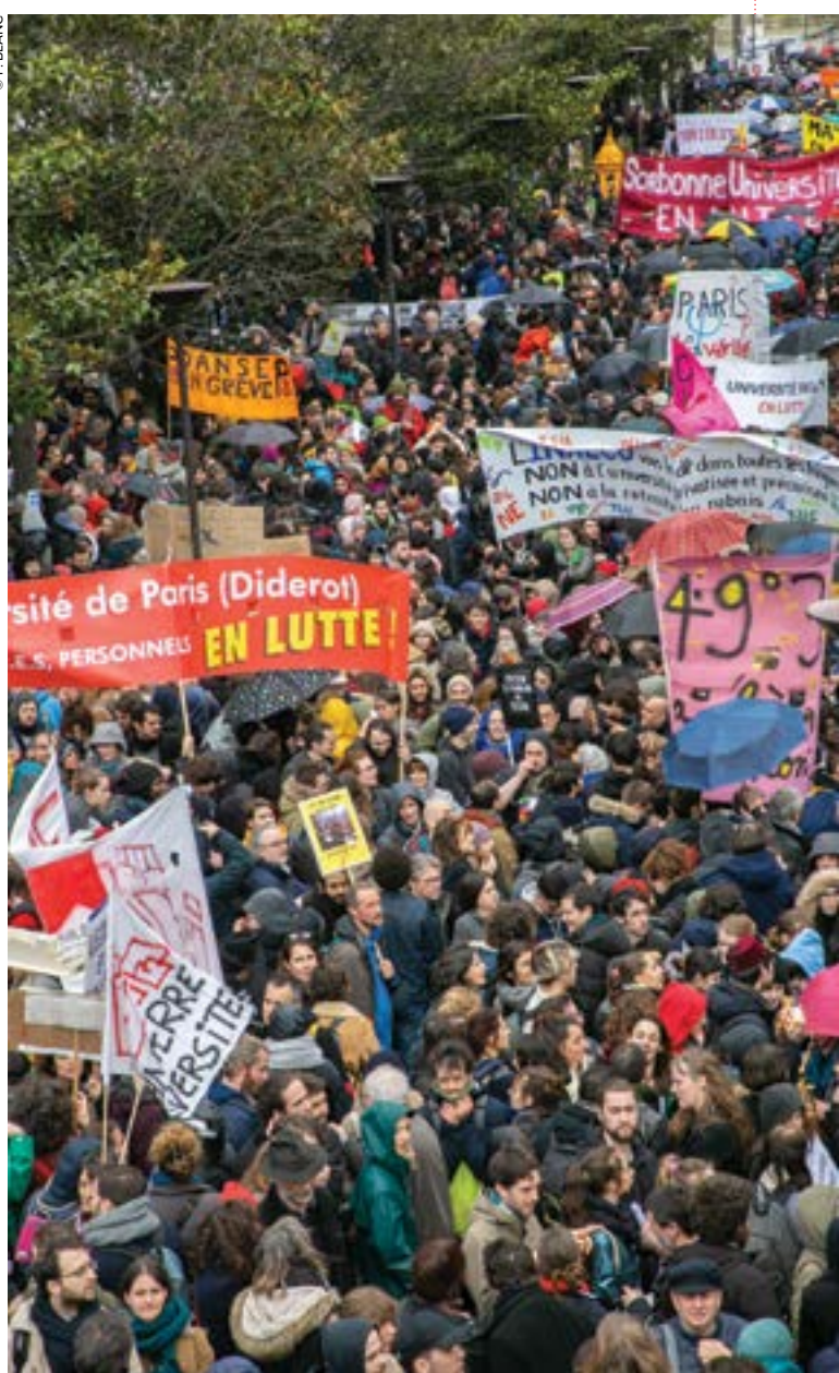
Le 5 mars 2020, 25 000 enseignants et étudiants-chercheurs étaient en grève et manifestaient dans toute la France (ici à Paris).