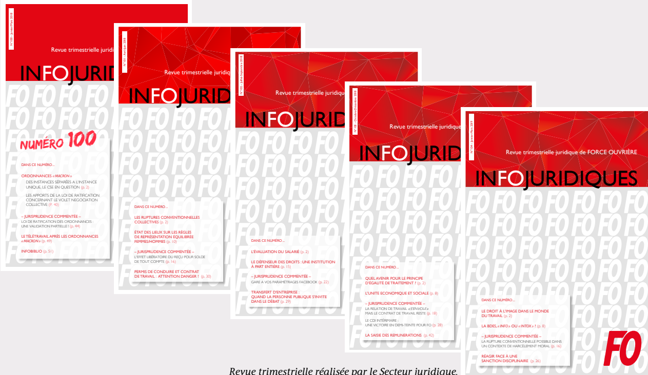
Revue trimestrielle réalisée par le Secteur juridique.

Le Secteur juridique édite une revue trimestrielle de droit qui permet aux militants de se tenir à jour des dernières évolutions, tant de la loi que de la jurisprudence.