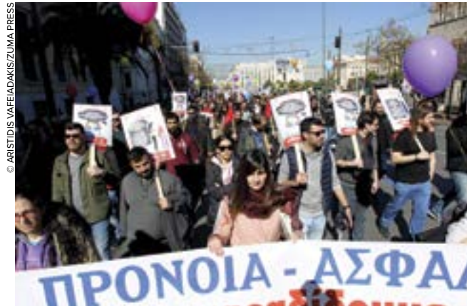
Manifestation du 18 février 2020 à Athènes.

La nouvelle réforme du système des retraites en Grèce n'est jamais que la cinquième étape d'un chantier démarré en 2010. Des dizaines de milliers d'agents publics mais aussi des salariés du privé s'y sont opposés le 18 février, par la grève et en manifestant dans une soixantaine de villes, à l'appel de la fédération des fonctionnaires (Adedy). « Stop au carnage dans le système de sécurité sociale », pouvait-on lire sur les banderoles. Cette nouvelle loi « n'est rien d'autre que le prolongement des lois d'austérité, adoptées pendant la crise (2010-2018) et ayant entraîné des réductions de pensions allant de 20% à 60% », dénonçait l'Adedy dans un communiqué. La réforme de 2016 a en effet supprimé tous les régimes spéciaux, fusionnés dans un fonds unique de sécurité sociale