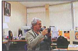
Le journaliste de la N.R.