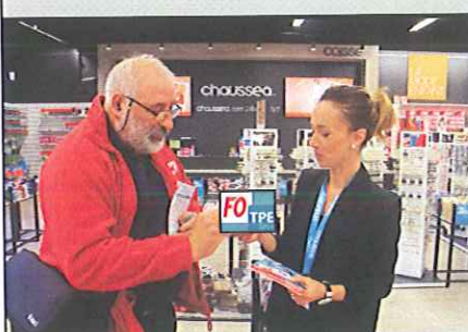
Distribution de tracts à Chambray-les-Tours Pendant la campagne TPE 2016

Mes chers camarades, Nous avons enfin reçu après bien des difficultés les résultats départementaux pour la région centre. La confédération a du faire un gros travail de synthèse à cette occasion, l'état étant incapable via son prestataire privé de nous donner quelque chose d'exploitable. En Indre et Loire le travail de terrain a payé : l'UD FO 37 assure encore sa seconde place dans le département assez loin devant de la CFDT et l'UNSA. Notre département apporte près de 30% des voix FO de la région centre. la CGT reste largement en tête dans les 6 départements de la région. la campagne massive de diffusion dans les TPE du 37 a payé comme notre présence régulière sur le terrain depuis des mois. le taux de participation reste faible à 8,85% mais bien supérieur au niveau national. Les secteurs où nous n'avons pu faire campagne enregistrent des résultats plus faibles.... Il est dommage que sur la région Centre nous n'avons pu enregistrer les mêmes résultats ce qui nous aurait permis de conserver notre seconde place que nous perdons à 8 voix près chez les cadres.