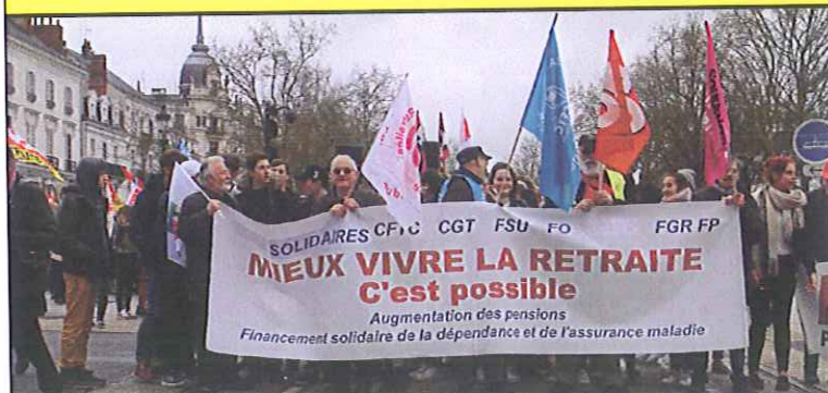
Banderole lors d'une manifestation revendicative de retraités à Tours le 10 03 2017