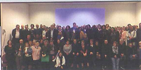
Big stage pour les représentants FO de Carrefour animé par l'UD FO 37

... VOTER POUR UN SYNDICAT LIBRE ET INDÉPENDANT