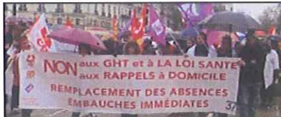
La manif à TOURS le 7 mars sous une pluie battante

Oui, la loi travail va faciliter encore plus les lock-out et les délocalisations, en facilitant