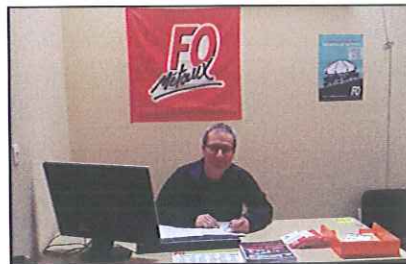
Photo du nouveau bureau de l'UL FO Amboise. Permanence tous les mardi de 17h à 18h30.

L'UNION LOCALE FOREC OUVRIERE D'AMBOISE : 14 ANS DE SERVICES RENDUS AUX SALARIES !