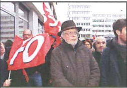
Rassemblement devant le conseil des prud'hommes de Tours le 26 janvier 2015

Deux cents militants avaient répondu à l'appel lancé par les organisations syndicales départementales C.G.T., F.O., F.S.U., UNSA et SUD.