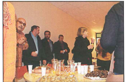
Dans les locaux de l'U.D. le fraternel repas du midi.

Pour 2015 les objectifs sont clairement énoncés par le secrétaire du SDAS FO.