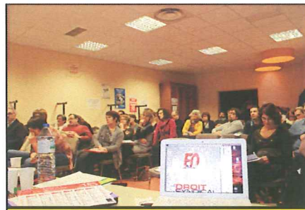
Plus de cinquante de militants réunis à la « Rotonde »

Pas de réponse en forme de recette aux questionnements légitimes des militants. Seulement des tentatives d'élaborations de stratégies pour développer un syndicalisme revendicatif, c'est-à-dire un syndicalisme libre et indépendant.