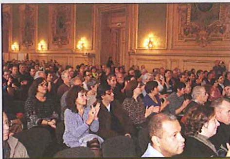
Dix heure du matin, 25 NOVEMBRE : 300 personnes dans la salle des fêtes à la Mairie de TOURS.