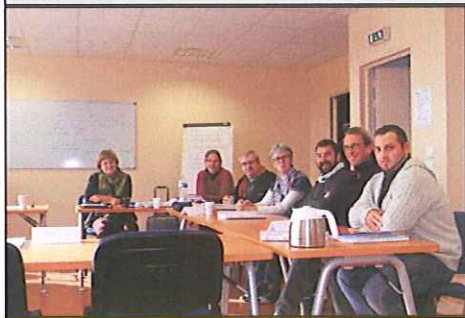
Dernier stage « comité d'entreprise » 2014

La plupart du temps, malgré nous, nous assistons à une inflation de législation qui modifie le droit du travail et le droit conventionnel.